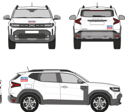
Beschriftung bei einem weißen Firmenfahrzeug Das Design funktioniert mit dem eigenen Firmenlogo oder LIQUI MOLY Standard-Logo.